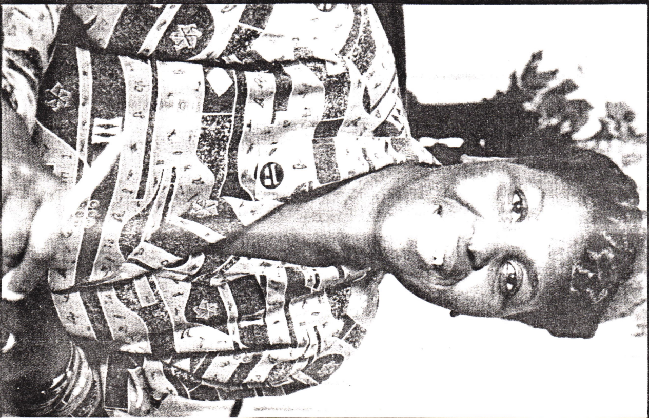
Senadora Benedita da Silva