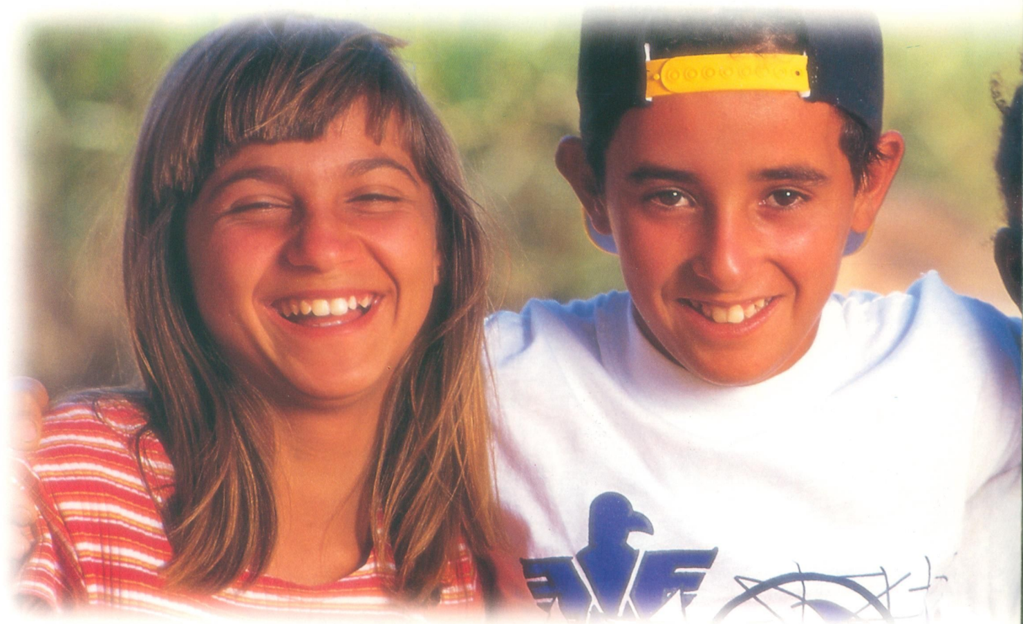
As crianças desta foto são beneficiadas pela Bolsa Criança Cidadã. Ribas do Rio Pardo - MS.

crianças carentes. A Associação Brasileira Multiprofissional de Proteção à Infância e Adolescência (Abrapia) vem realizando estudos e desenvolvendo programas de proteção e prevenção relativas à violação dos direitos de crianças e adolescentes.