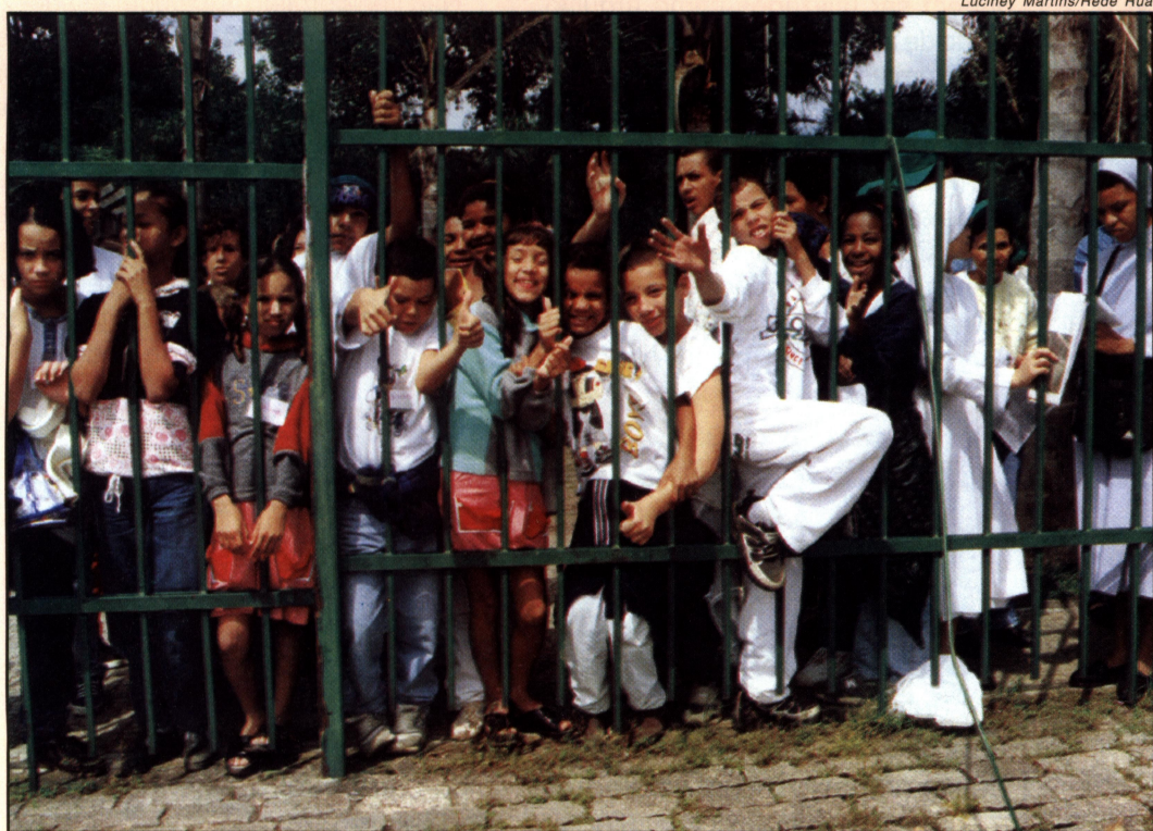
Prefeito alega compromisso urgente, envia secretário para receber crianças.

ENTRE AS EXIGÊNCIAS CONTIDAS NA CARTA ENCAMINHADA AO PREFEITO CELSO PITTA ESTÃO AS SEGUINTE: