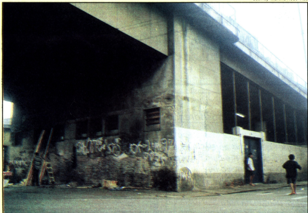
Luciney Martins/Rede Rua