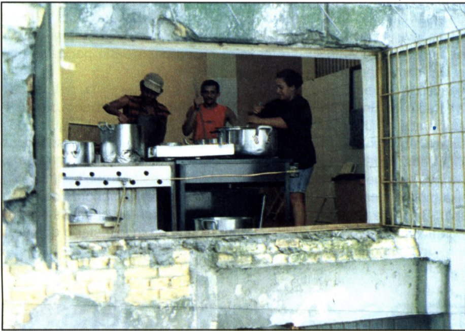
Viaduto do "Cascudas" - por dentro aconchego; por fora descaso da Prefeitura

Mesmo sendo compreensivo que poucos grupos com esta origem achem inadequado o local que conquistaram com tanto sacrifício, a verdade é que sempre soará falso quando falarem de atendimento de qualidade embaixo de viadutos.