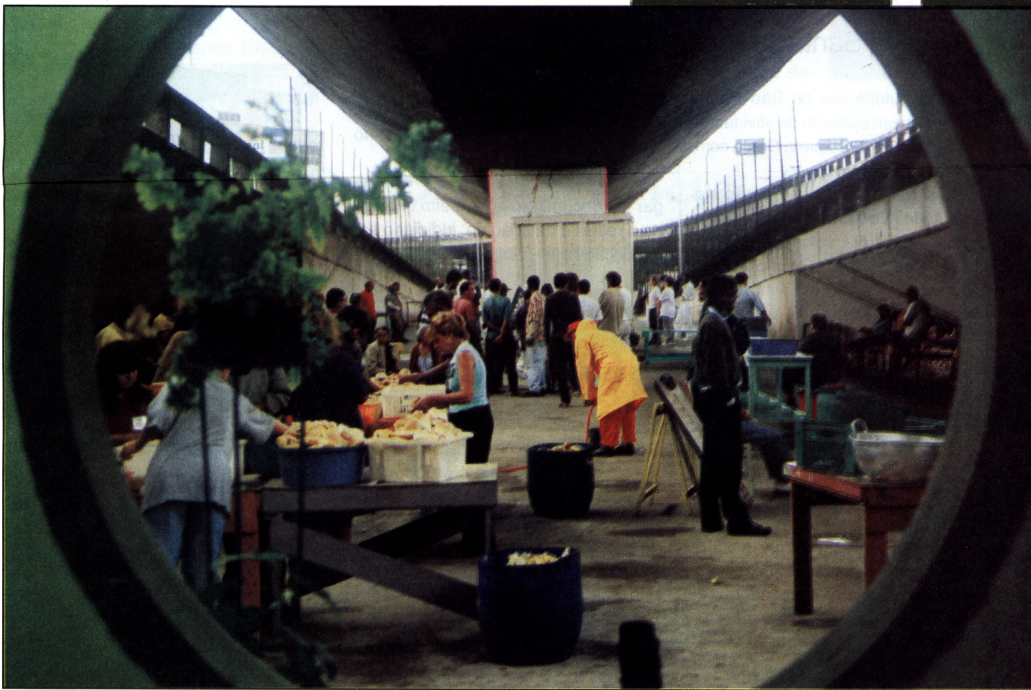
Projeto minha Rua minha Casa - embaixo do Viaduto Glicério