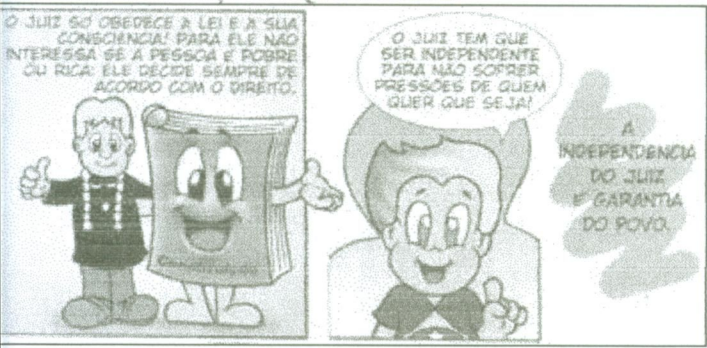
O juiz só obedece à Lei... o juiz tem que ser independente... Os juizes dos casos relatados leram a "Cartilha da Justiça em Quadrinhos", da Associação dos Magistrados Brasileiros?