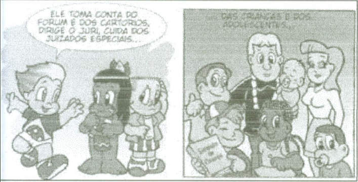
Ele [juiz] cuida dos juizados especiais das crianças e dos adolescentes...