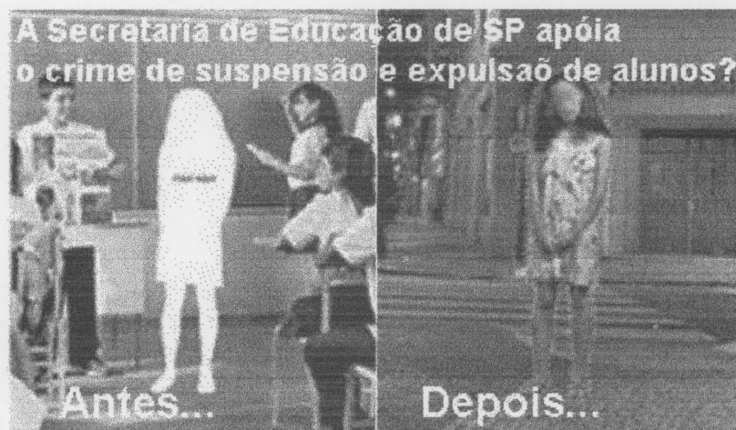
Fotomontagem invertendo a proposta do Criança Esperança - TV Globo.

"as punições da rede (advertências, suspensões e transferências, por exemplo) continuam normalmente".