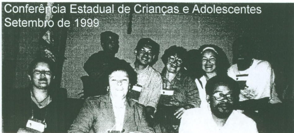
Conferência Estadual de Crianças e Adolescentes Setembro de 1999

Educador do Núcleo de Trabalhos Comunitários da PUC/SP