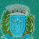
Prefeitura Municipal Cássia dos Coqueiros