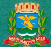
Prefeitura Municipal Ribeirão Preto