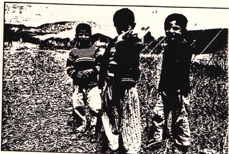
Iraque - algumas restrições à Convenção