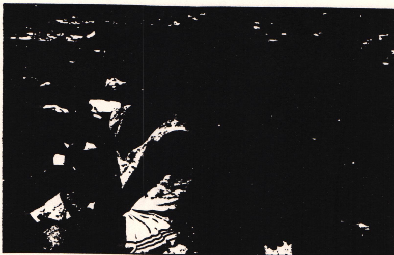
A Convenção – um padrão mínimo para os cuidados e para a proteção da criança.

Estas páginas apresentam os países que ainda não ratificaram a Convenção, e os países que ainda não enviaram seus relatórios sobre as ações práticas já realizadas para implementá-la.