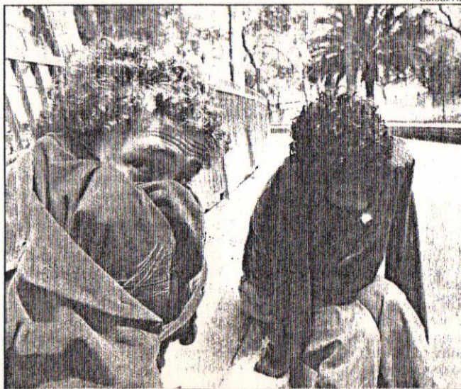
C., de 17 anos, na Praça da República: desejo de largar o crack