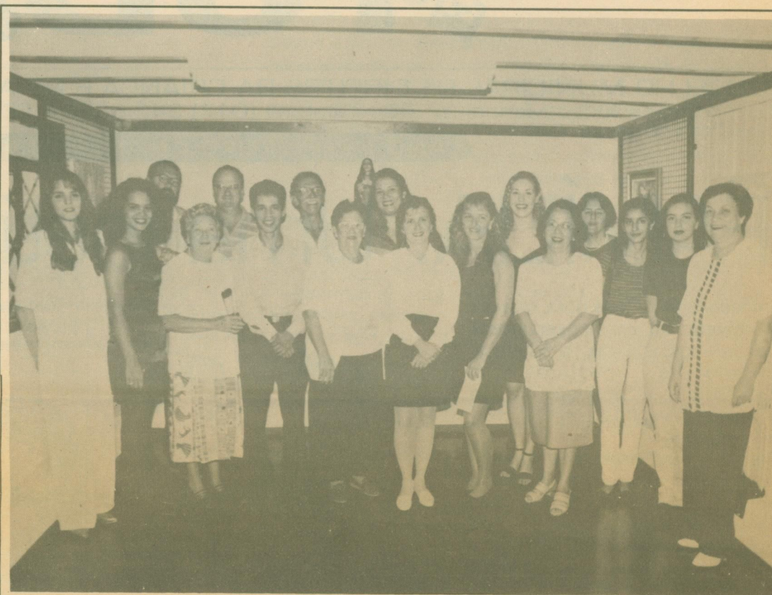
Dep. Cultura: Dia Internacional da Mulher - 1996.

Em comemoração ao Dia Internacional da Mulher, aconteceu no dia 08/03/96 na sala