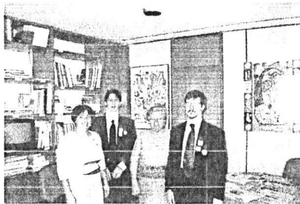
Reunião com a Deputada Federal Luiza Erundina (PSB).

Dirigimo-nos à Câmara dos Deputados, onde conversamos com a Deputada Federal Luiza Erundina do PSB. A deputada colocou-se, representando o seu partido, e disse que também está nessa luta contra a redução da idade penal.